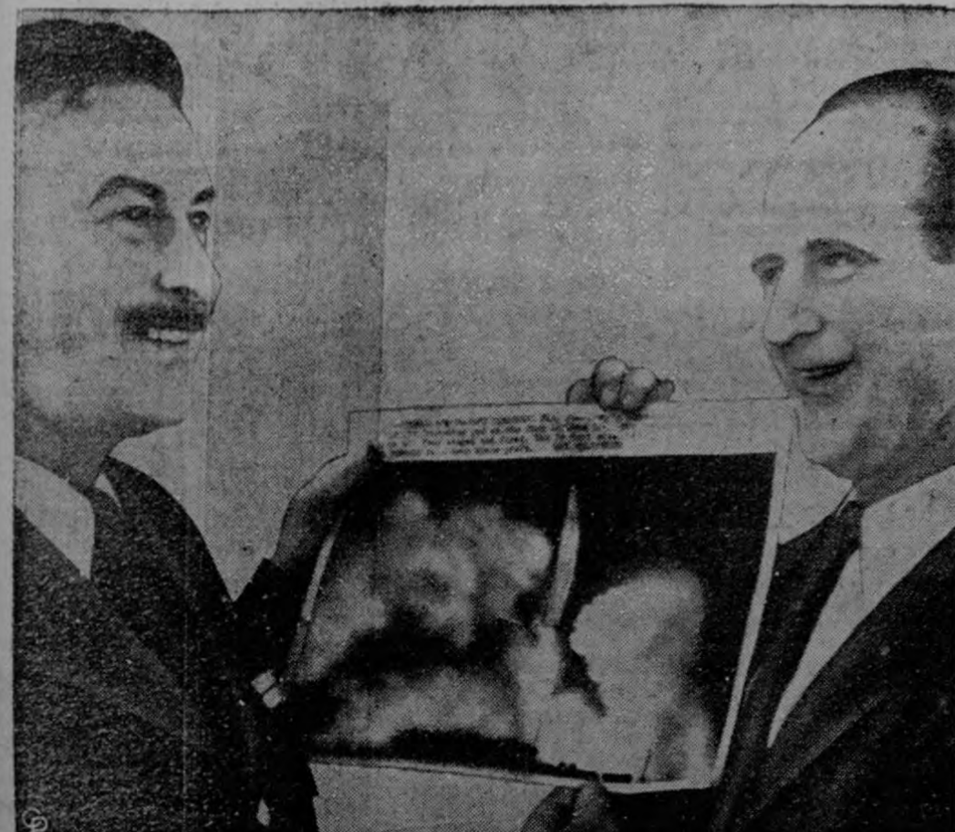
El General J. B. Medaris (izquierda), jefe de Estados Unidos, y el Dr. William H. Packering, director de la Sección de Cohetes del Ejército de Estados Unidos, sujetan una fotografía del cohete Juno Segundo, que fue el quinto intento de Estados Unidos. El cohete disparó hacia la vecindad de la luna, y luego terminó en un estrellido