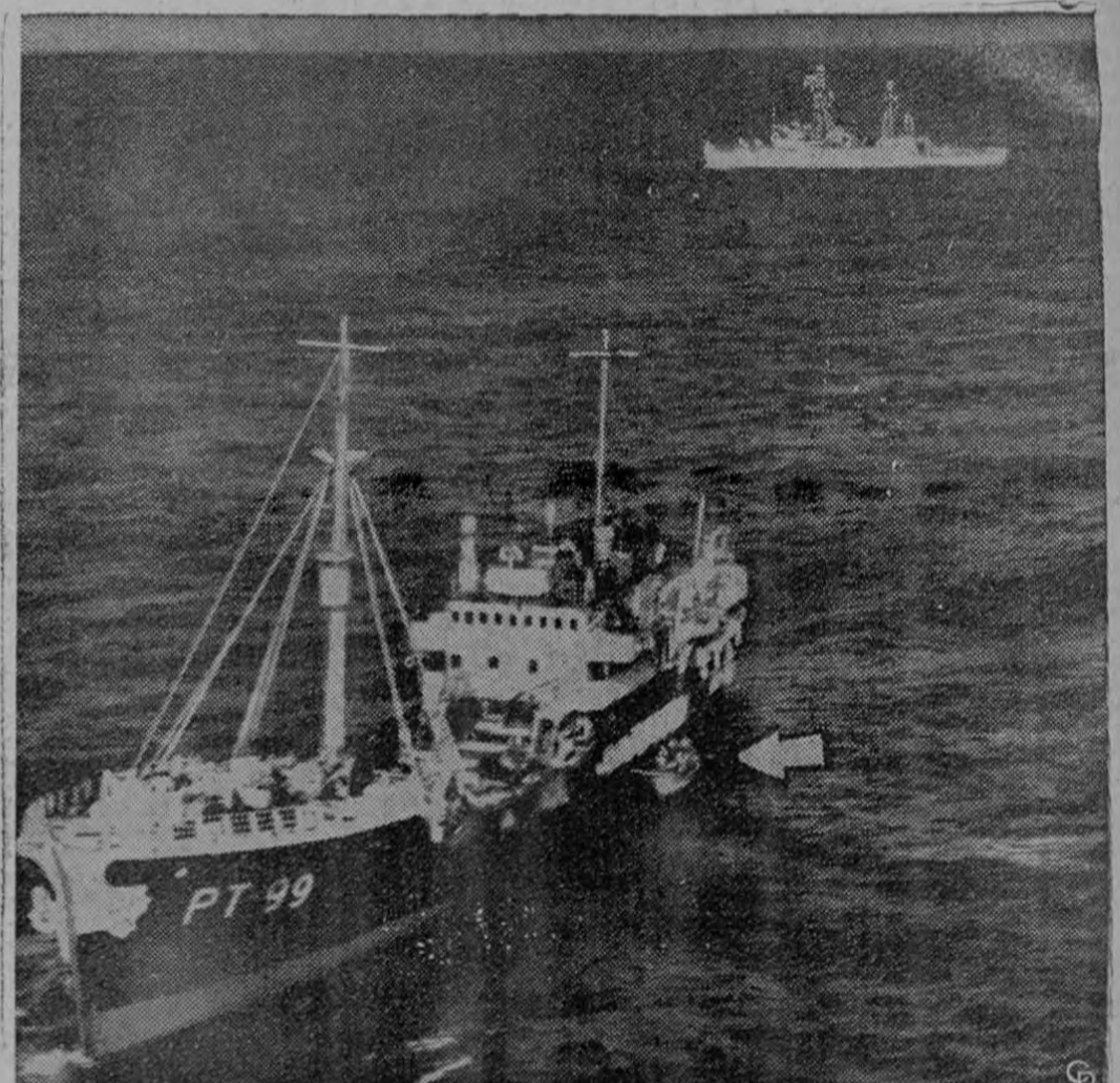
Un bote (flecha), con una partida de abordaje de la armada de Estados Unidos, enviada desde el destructor Roy O. Hale (al fondo), se acerca al pesquero ruso Novorossik, como a 180 millas al noreste de St. John's, en Nueva Escocia. Siguiendo órdenes de la marina, la tripulación del bote inspeccionó el barco rojo después que los cables transatlánticos submarinos fueron cortados en el área donde el Novorossik estaba pescando.