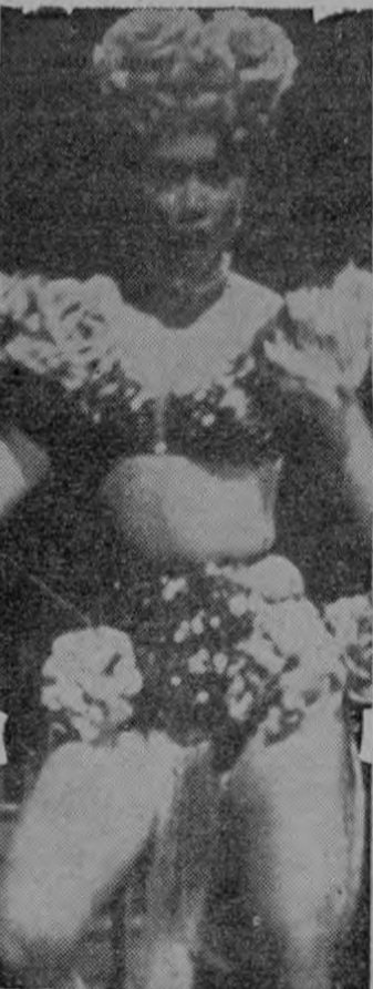
NINON SEVILLA La mulata de fuego